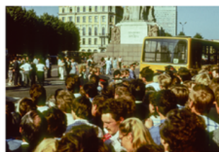
Latvijas Republikas neatkarības atjaunošana