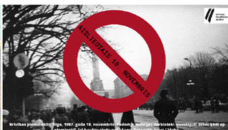
Nevardarbīgā pretošanās padomju okupācijas režīmam