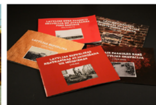
Latvijas vēstures pārskati