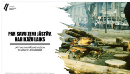
Barikādes 1991. gada janvārī un Latvijas Republikas neatkarības atjaunošana