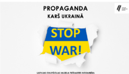
Krievijas propaganda, kas ar dezinformāciju un meliem mēģina attaisnot savas valsts veiktos noziegumus pret Ukrainas tautu un valsti.