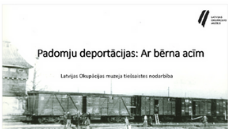
Padomju varas īstenotās 1941. un 1949. gada iedzīvotāju masveida deportācijas