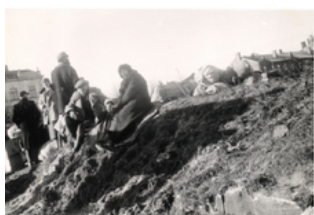
Otrais pasaules karš