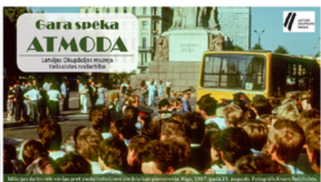
Atmodas laiks (1986-1991)